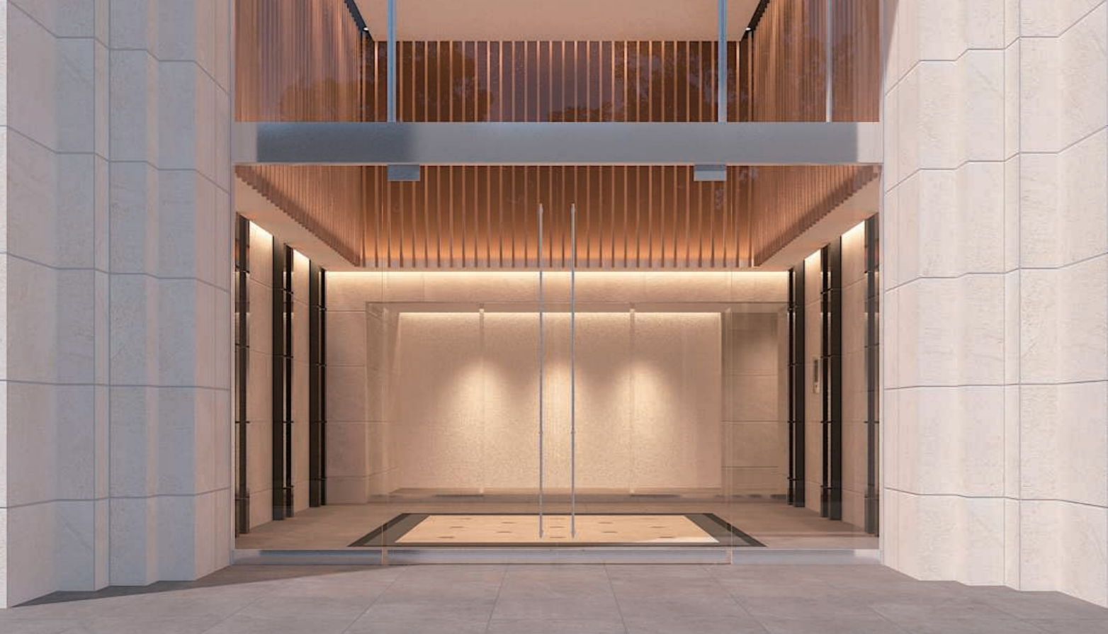
設置マンションのエントランスホールイメージ