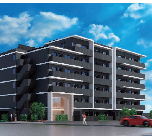
設置マンションの外観イメージ

実際のマンションエントランスに作品を仮設置し、 プレゼンテーションしていただきます