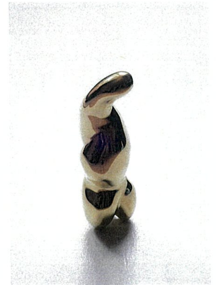
natural human 40×130×40 (mm) 真鍮