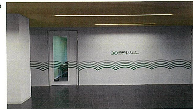
国際観光学研究センター（経済学部南棟） エントランス内壁デザイン