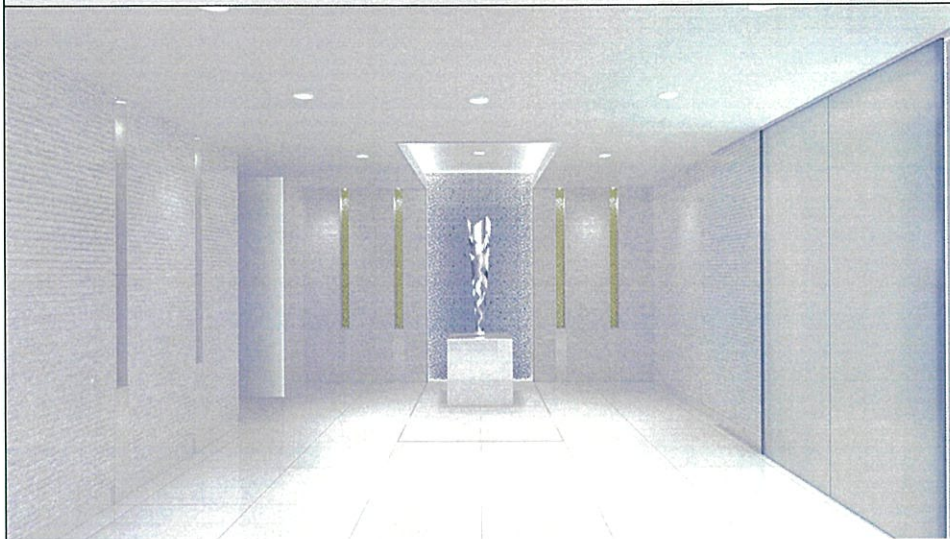
作品設置イメージ